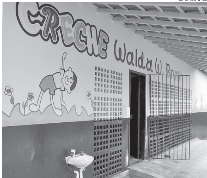
Obras trouxeram reforma de pisos, cobertura, revisão elétrica e hidráulica, além da substituição de grades e revitalização da fachada

mero de novas vagas em creches geradas durante a atual gestão. Isso é motivo de muita alegria e o município não está medindo esforços para melhorar e expandir cada vez mais os números. A Creche Municipal Professora Walda Walkyria Bruno é mais um fruto de todo esforço e uma conquista importante. Mostra como é possível fazer muito com pouco,