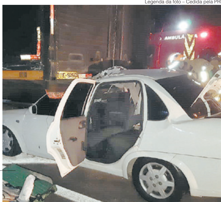
Legenda da foto - Cedida pela PRF

Acidente entre carro e caminhão no sentido Rio deixa dois gravemente feridos