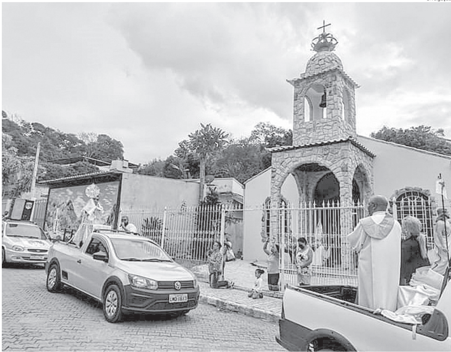
A solenidade tem início com uma missa às 8h30min

“É buscar estar em comunhão profunda com Jesus e se identificar com ele. É comungar das dores das pessoas que estão sofrendo e com as famílias enlutadas. É sermos solidários, termos empatia e compaixão com todos. Além disso, é momento de cuidar da vida que Deus nos deu, nos protegendo para que possamos permanecer vivos”, finalizou o padre.