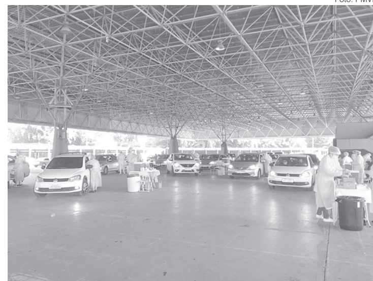
Trabalhadores em atividade da rede pública e privada receberam a primeira dose da vacina AstraZeneca

A vacinação para os profissionais de Educação, ainda não vacinados, terá conti-