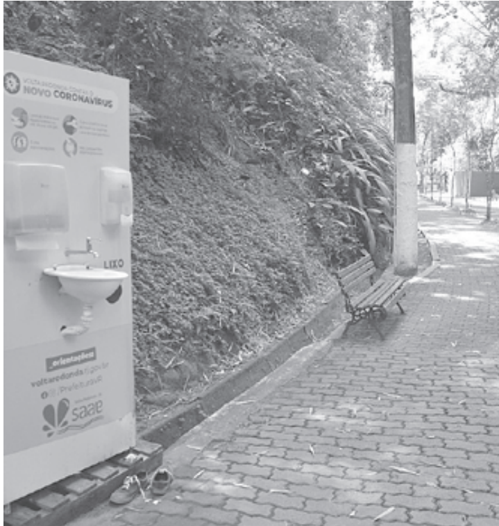
Número de visitantes é restrito a 300 pessoas pela manhã e 300 à tarde