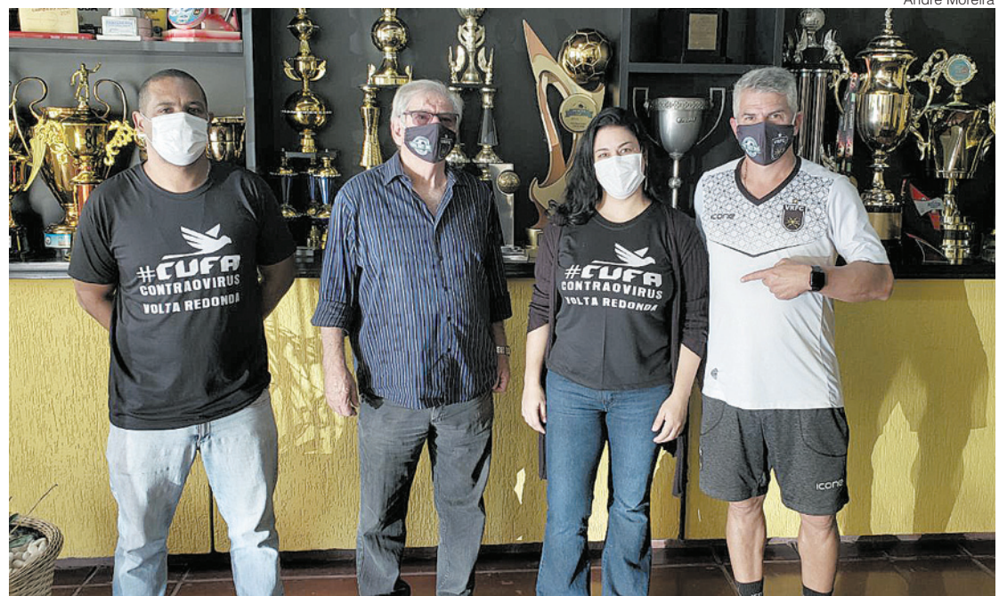
Voltaço se une a outros 44 clubes de diferentes divisões; Camoanha tem início no próximo dia 21

O Volta Redonda é muito mais que um clube de futebol dentro da cidade de Volta Redonda. Temos uma abrangência nacional, levamos o nome do município para todo o Brasil, conquistamos torcedores em todos os lugares do país e até do exterior, e, com isso, também é criado uma responsabilidade social muito grande. Por isso, sempre que possível, procuramos contribuir com a sociedade, seja com doações de alimentos arrecadados em nossos jogos ou em campanhas espetaculares como esta da CUFA. Quando recebemos o convite, não pensamos duas vezes em aceitar e somar forças com grandes clubes do Brasil para fazer o Mães da Favela Futebol Clube ser um sucesso. Para isso, precisamos que os nossos torcedores também comprem a ideia e façam a sua doação, porque temos certeza que, juntos, poderemos ajudar muitas famílias neste momento tão difícil que estamos passando - afirmou o mandatário tricolor.