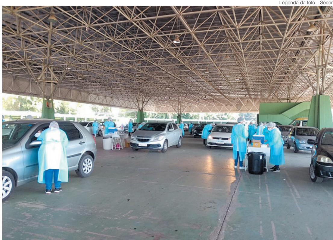
Legenda da foto

Imunização aconteceu no sistema drive-thru na Ilha São João, em Volta Redonda