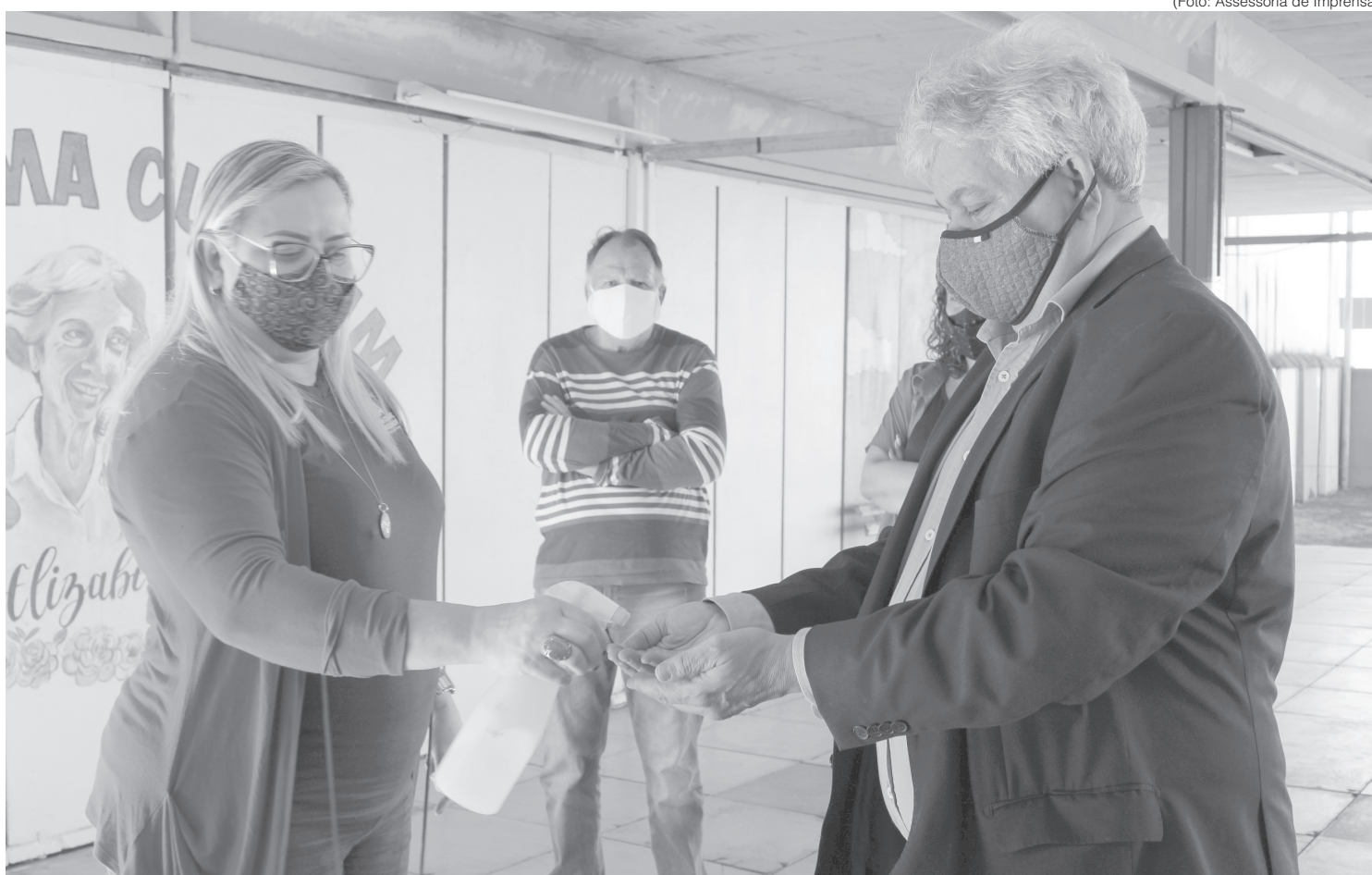
Deputado chega para visitar Casa da Criança e Adolescente

Já o convênio para Programa Curumim terminou em outubro passado. O programa funciona em dois núcleos: um no bairro Volta Grande e outro na 249, atendendo 195 e 120 crianças, respectivamente. Desde abril, as ações do projeto