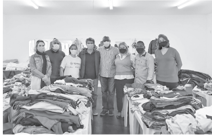
Assistência social também define 2 datas para entrega às famílias