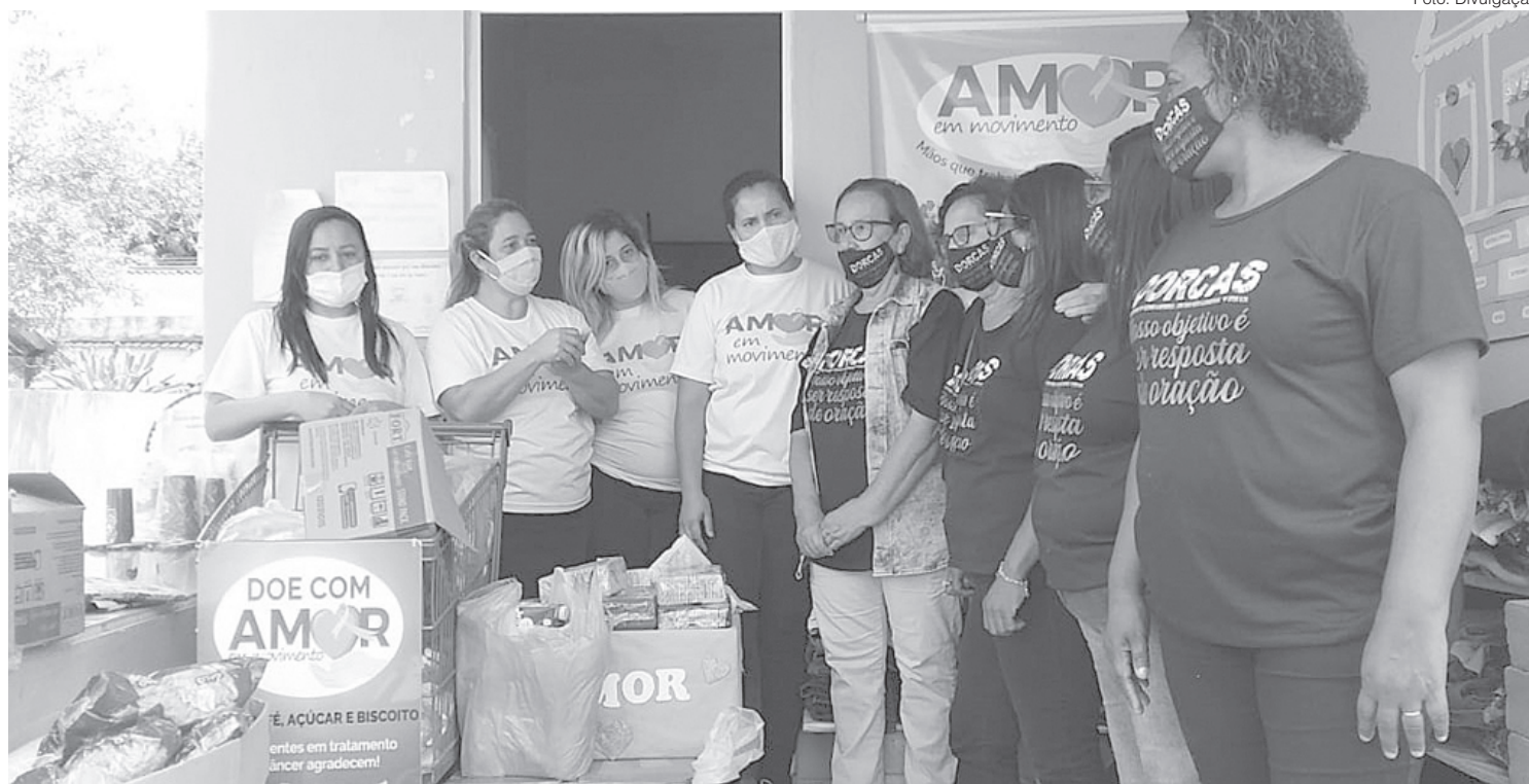
Casa Rosa está completando um ano e meio de fundação

O local oferece café da manhã e da tarde; almoço, atendimento com psicóloga, psicanalista, nutricionista e assistente social; local de descanso; sala de cura e massagem relaxante; doação de perucas, próteses mamárias, almofadas terapêuticas e cestas básicas. Os serviços acontecem de forma gratuita para o paci-